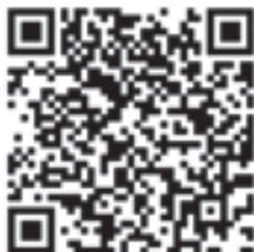
Google Play/App Store

You can also search for the app directly from the Google Play or the App Store .